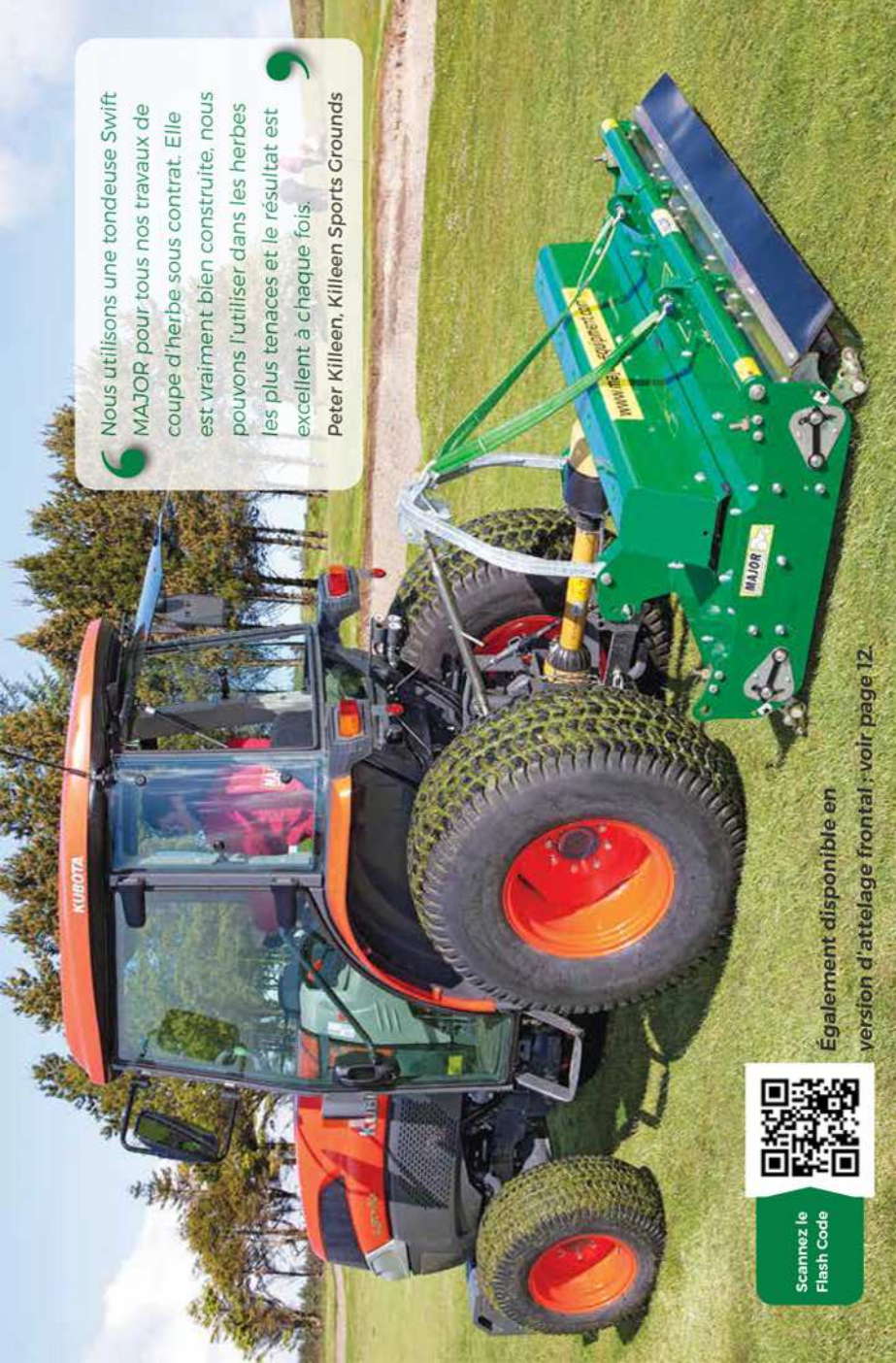
Egalement disponible en version d'attelage frontal ; voir page 12.

Nous utilisons une tondeuse Swift MAJOR pour tous nos travaux de coupe d'herbe sous contrat. Elle est vraiment bien construite, nous pouvons l'utiliser dans les herbes les plus tenaces et le résultat est excellent à chaque fois. Peter Killeen, Killeen Sports Grounds